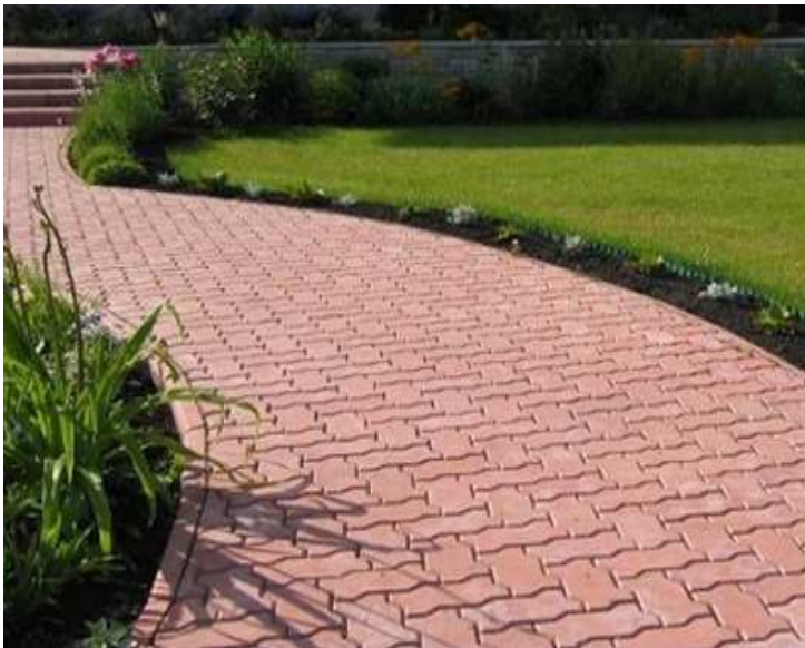
Exemples de Calpinage