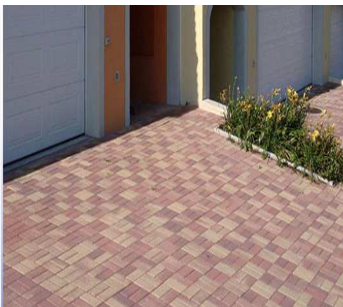
Exemples de Calpinage